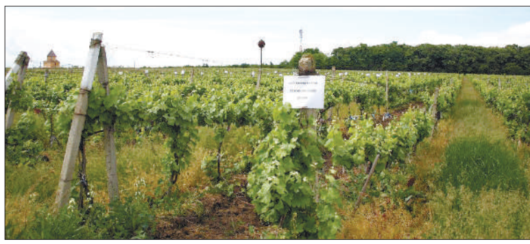
Viile Stațiunii, atacate din toate părțile de proiecte imobiliare

► un proces de retrocedare început acum aproape 30 de ani, în urma căruia unii s-au îmbogățit între timp, ar putea avea parte de o surpriză uriașă în instanță ► după 15 ani de când au rămas fără aproape 25 de hectare,