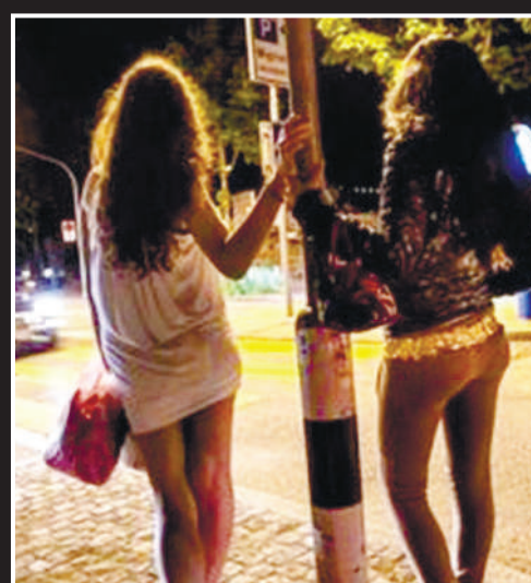
Tineretele erau exploatate sexual în orașe din Grecia și Germania

► Parcursul incredibil și faptele îngrozitoare din dosar, pe larg, în pagina 3