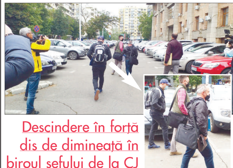
Descindere în forță dis de dimineață în biroul șefului de la CJ