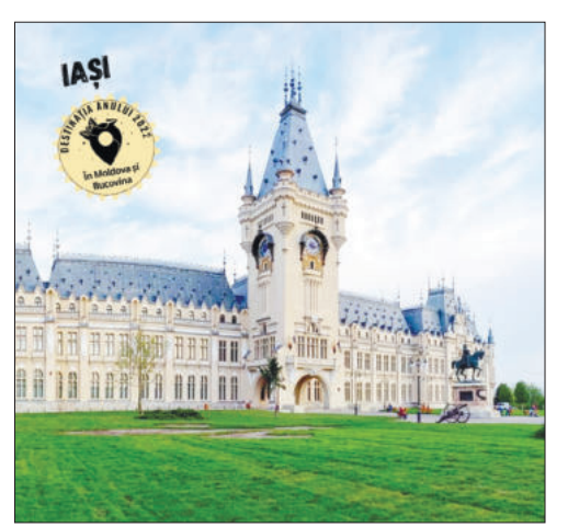
grupate în două categorii: City Break și Localități Turistice.

Iașul are nevoie de voturi în competiția pentru desemnarea titlului „Destinația Anului 2022”, la categoria City Break. Cu doar o săptămână înainte de “inchiderea urnelor”, orașul Târgoviște conduce la numărul de voturi. Se poate vota pe site-ul www.destinatiaanului.ro . “Până în prezent, lupta este strânsă la categoria City Break unde Brașov, Iași și Târgoviște se află la mai puțin de 1000 de voturi distanță, cu un ușor avans pentru Târgoviște”, au anunțat organizatorii concursului, care susțin că peste 50.000 de oameni au votat până acum pe platforma www.destinatiaanului.ro pentru una din cele șase destinații finaliste,