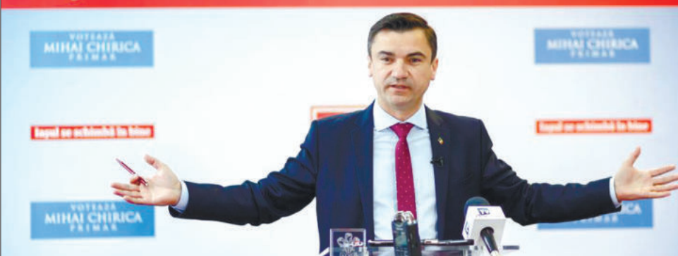
Administrația Chirica plătește regește

► unii dintre oamenii de încredere ai primarului câștigă și de două ori cât președintele României ► sumele sunt amețitoare și pentru directorii din mediul privat care lucrează 10-12 ore pe zi ► culmea, la salarii de mii de euro, în unele cazuri, se adaugă și pensii consistente ► citiți în pagina 2