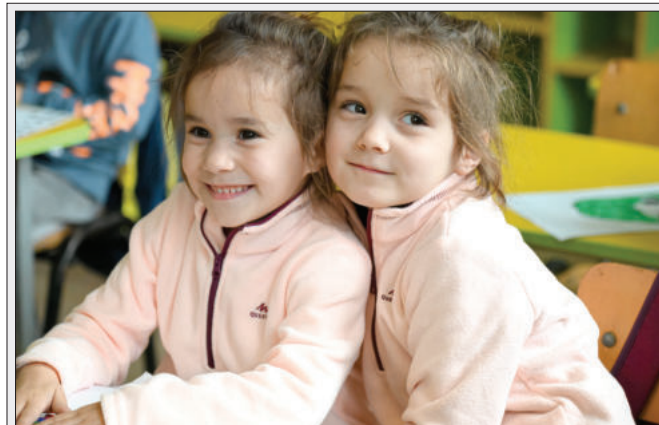
Noi donatori în Campania de Crăciun